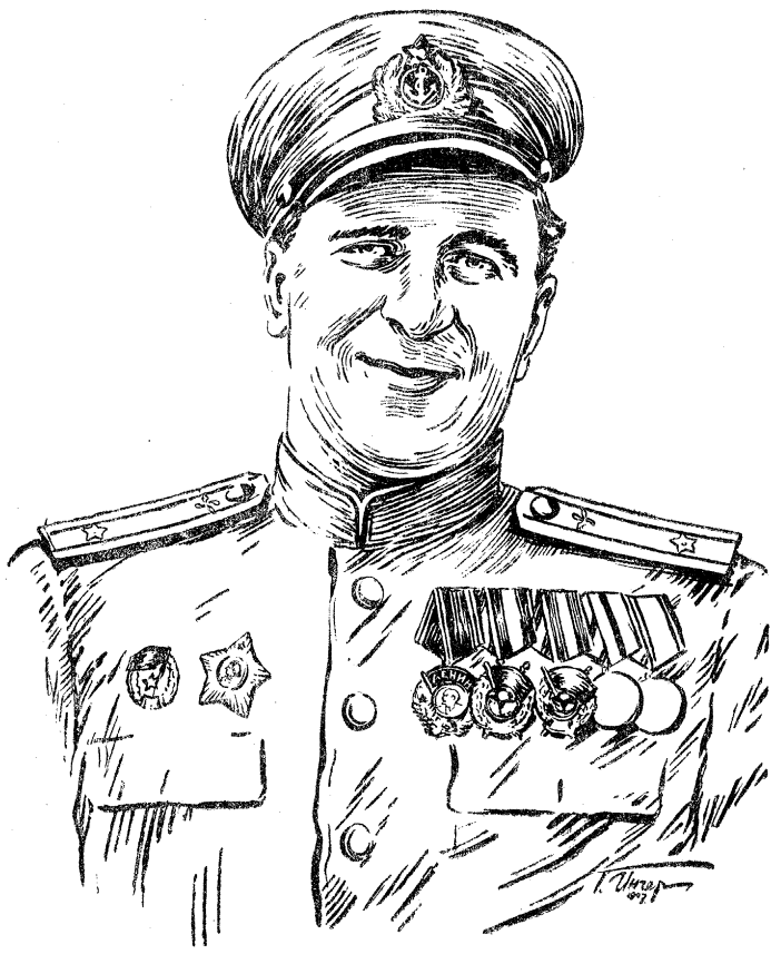
מאיר ד. יע. ניכאמינ